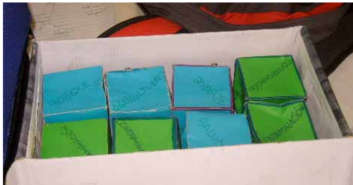
Figura 1: Foto de Dados Conceptuales.

El “juego” de los Dados Conceptuales tienen como objetivo ayudar al “jugador” – ya sea docente, estudiante, o cualquier persona construyendo un mapa conceptual – a comprender que una proposición consiste, en su forma más sencilla, de dos conceptos enlazados por una o más palabras de enlace formando una afirmación. Cada jugador (o grupo de jugadores si el mapa está siendo construido en grupo) tiene dos dados. Cada dado es un cubo de seis lados, similar a los dados usados en juegos de azar. En cada cara de cada dado, se escribe un concepto diferente, de manera que se inicia con una lista de doce conceptos (ver la Figura 1). Esta lista puede haber sido preparada por el docente como andamio para sus estudiantes, o puede ser generada por el “jugador”. Como siempre en la construcción de un mapa conceptual, debe especificarse claramente la “pregunta de enfoque” a la cual responderá el mapa (Novak & Cañas, 2006).