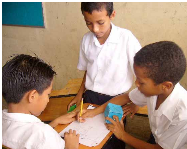
Figura 2: Estudiantes generando proposiciones basadas en los dados conceptuales.

El experimento se aplicó a niños y docentes de escuela primaria. La muestra consistió de 60 niños de escuela primaria divididos en 20 niños de sexto grado, 25 niños de quinto grado y 15 de cuarto grado; y 91 docentes de escuela primaria que participaban talleres capacitación del Proyecto Conéctate al Conocimiento, donde aprenden el uso de mapas conceptuales.