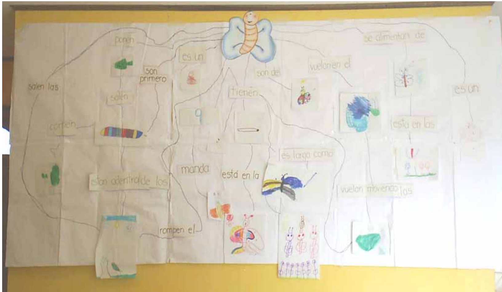
Mapa Conceptual "La Mariposa" elaborado por el grupo de Transición, Centro Educativo Fray José Antonio de Liendo y Goicoechea. Paraíso, Cartago.