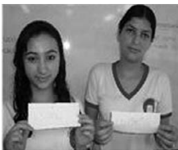
Figura 2. Estudiantes socializando su Proposición

Cada estudiante toma un concepto del tablero, puede o no ser el que escribió anteriormente y busca un compañero que tenga un concepto que pueda relacionar con el suyo formando una proposición. Para relacionarlos se usan las “palabras de enlace” o “frases de enlace”.