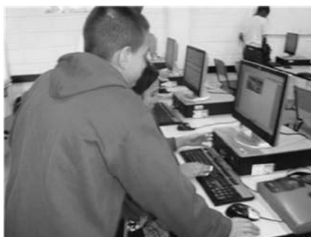
Figura 3. Estudiantes trabajando por parejas

Los estudiantes, organizados en parejas (Figura 3), debido al número de equipos de cómputo disponibles, empiezan a armar su mapa conceptual. Se pueden ayudar con las proposiciones que hicieron todos sus compañeros. Todos los conceptos que eligió el grupo deben quedar unidos en proposiciones simples.